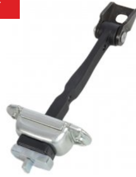
Oe Ref: 1Z0 839 249D 1Z0 839 249C DOOR CHECK STRAP OCTAVIA II ( 2005 - 2013 ) REAR RIGHT , REAR LEFT