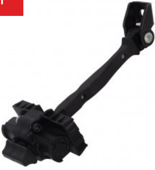
Oe Ref: 6V0837249 DOOR CHECK STRAP FABIA III ( 2015- ) FRONT RIGHT , FRONT LEFT