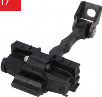
Oe Ref: 5J0 839 249D 5J0 839 249C 5J0 839 249B DOOR CHECK STRAP ROOMSTER ( 2006 - 2015 ) REAR RIGHT , REAR LEFT