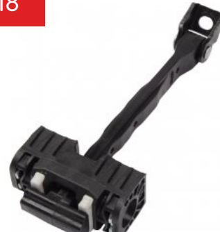
Oe Ref: 565 839 249 DOOR CHECK STRAP KODIAQ ( 2016- ) REAR RIGHT , REAR LEFT