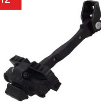
Oe Ref: 6V0839249 DOOR CHECK STRAP FABIA III ( 2015- ) REAR RIGHT , REAR LEFT