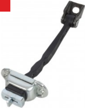
Oe Ref: 1Z0 837 249D 1Z0 837 249B DOOR CHECK STRAP OCTAVIA II ( 2005 - 2013 ) FRONT RIGHT , FRONT LEFT