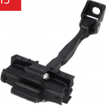
Oe Ref: 5E0 837 249A 5E0 837 249 DOOR CHECK STRAP OCTAVIA III ( 2013- ) FRONT RIGHT , FRONT LEFT