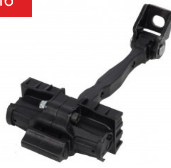
Oe Ref: 5E0 839 249A 5E0 839 249 DOOR CHECK STRAP OCTAVIA III ( 2013- ) REAR RIGHT , REAR LEFT